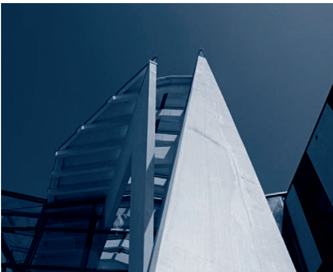
Paul-Wunderlich-Haus Eberswalde